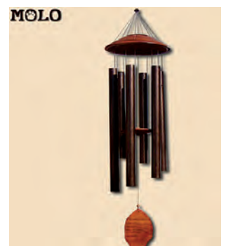
Windspiel Zu finden z. B. auf Märkten und in Kunsthandwerk-Geschäften.