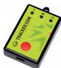
GPS-Ortungsgeräte (Tracker, kein Telefon), am Gürtel tragbar