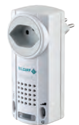
Tür-Kontaktschalter mit Steckdosen-Melder