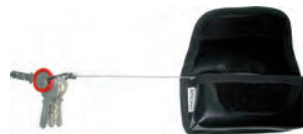
Lokalisierungsgerät für Schlüssel (Schlüsselfinder)