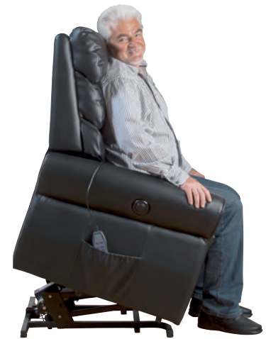
Drehscheibe zur Transferhilfe