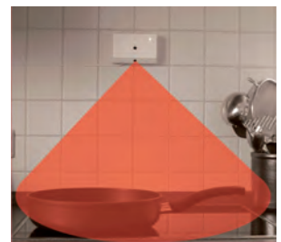
Herdüberwachung mit automatischer Herdabschaltung für Elektroherde