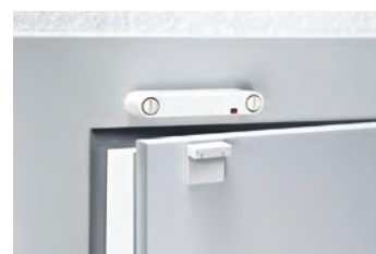
Meldesystem bei Türen: Wenn jemand durch die Türe geht wird dies mit einem Tonsignal signalisiert.