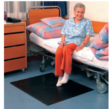
Kontakt-Trittmatte mit druckempfindlichen Sensoren